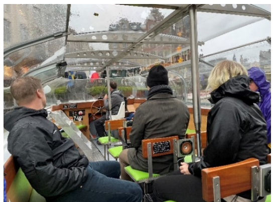
Bådture med Gent som vært